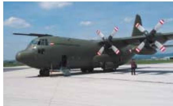
C-130 Herkules des Bundesheeres: Keine Business Class